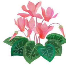
この花わかる？ 12月の花だよ。

期末考査が終了しました。今回の手応えはどうだったでしょうか？「もっとやっておけば良かった」「全然ダメだった」なんて言っていないですか？卒業まで3ヶ月となりましたが、残り少ない高校生活をどう過ごすかは皆さん次第です。より充実した時間となるように一日一日を大切にしましょう。